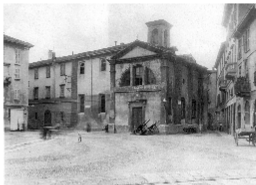
Piazza Sant' Ambrogio com'era

Indicare l'utilizzo o la forma interna dei nuovi corpi di fabbrica non rientra tra i nostri compiti, ma vorremmo comunque sottolineare l'opportunità di mantenere accessibile il terreno, traccia di un antico fossato.