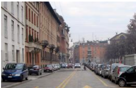
Lo stradone nel 1734 e il fondale attuale

Perché ricorrere alle figure consolidate nel tempo delle strade e delle piazze tematizzate? Perché, proprio come il Comune per abbellire la città costruisce nuovi teatri e nuove biblioteche nella presunzione che, se costituiscono un motivo estetico consolidato delle città da cinque secoli, promettono di durare altrettanto, allo stesso modo le strade e le piazze tematizzate, che risalgono anch'esse a centinaia di anni fa, possiamo legittimamente sperare che resteranno un motivo della bellezza della città per altrettanto tempo a venire, memoria della nostra generazione per i nostri figli e per i figli dei nostri figli.