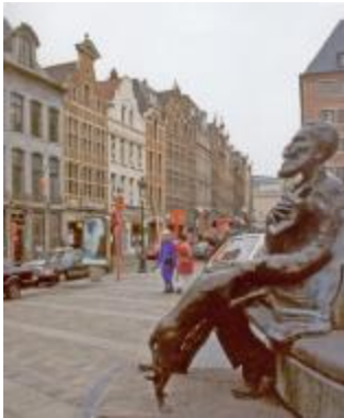
La statua di Buls a Bruxelles davanti a una schiera di case ricostruite recentemente in stile antico

Il secondo diventerà borgomastro di Bruxelles dopo una vivace campagna condotta contro gli sventramenti del suo predecessore Anspach (che sul modello parigino aveva tracciato il grande boulevard che porta oggi il suo nome sventrando i vecchi quartieri popolari intorno alla Senne) e soprattutto contro la demolizione della maison Stella sulla Grande place che, appena eletto, farà ricostruire com'era e dov'era.