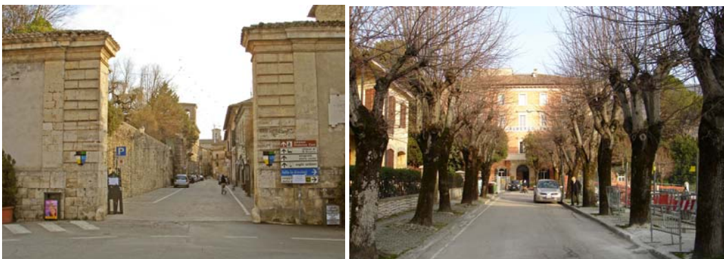
La porta della città e la passeggiata trionfale davanti al grand hotel

Una sequenza davvero molto ricca – forse allusione a una vocazione turistica di là da venire – ma che conferma, quattrocento anni dopo, il principio e l'intuizione dei Cesi di radicare il proprio palazzo al centro delle sequenze cittadine per ogni possibile futuro, sullo sfondo del borgo antico con le sue case di pietra e dei quartieri recenti le loro villette moderne come in ogni altra città, che forse anche queste tra mezzo millennio ci sembreranno pittoresche.