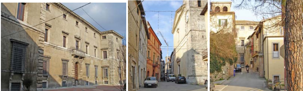
Palazzo Cesi, la piazza principale e la vecchia strada di accesso al borgo

I Cesi non intendono infatti isolarsi nel loro castello, ma apparire una famiglia integrata nella sfera simbolica romana. Ecco che la loro residenza mostra la vaga ambiguità dei padiglioni laterali sporgenti, che simulano le torri di un castello nel contesto architettonico di un maestoso palazzo cittadino del Cinquecento, non più isolato ai margini dell'abitato ma inserito nella sequenza di una nuova strada principale - che sostituisce quella antica, stretta e sinuosa, verso la porta Vecchia – disposta ora verso un allargamento, davanti al palazzo municipale e alla chiesa, che vorrebbe essere la piazza principale.