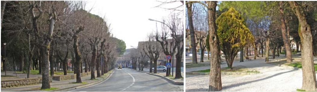
La passeggiata con il parco

Ma l'accentuazione dei temi collettivi persiste nei tempi moderni, nell'aver promosso quello stesso prato della fiera in una passeggiata grandiosa che avvolge il centro storico con una sorta di parco – inusitata anche nei paesi dell'Italia centrale, fitti di passeggiate – con il municipio moderno.