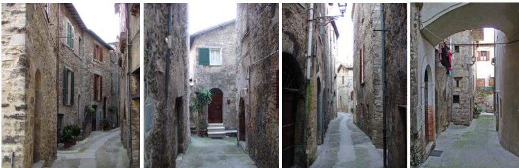
La piazza di palazzo Cesi e le case comuni