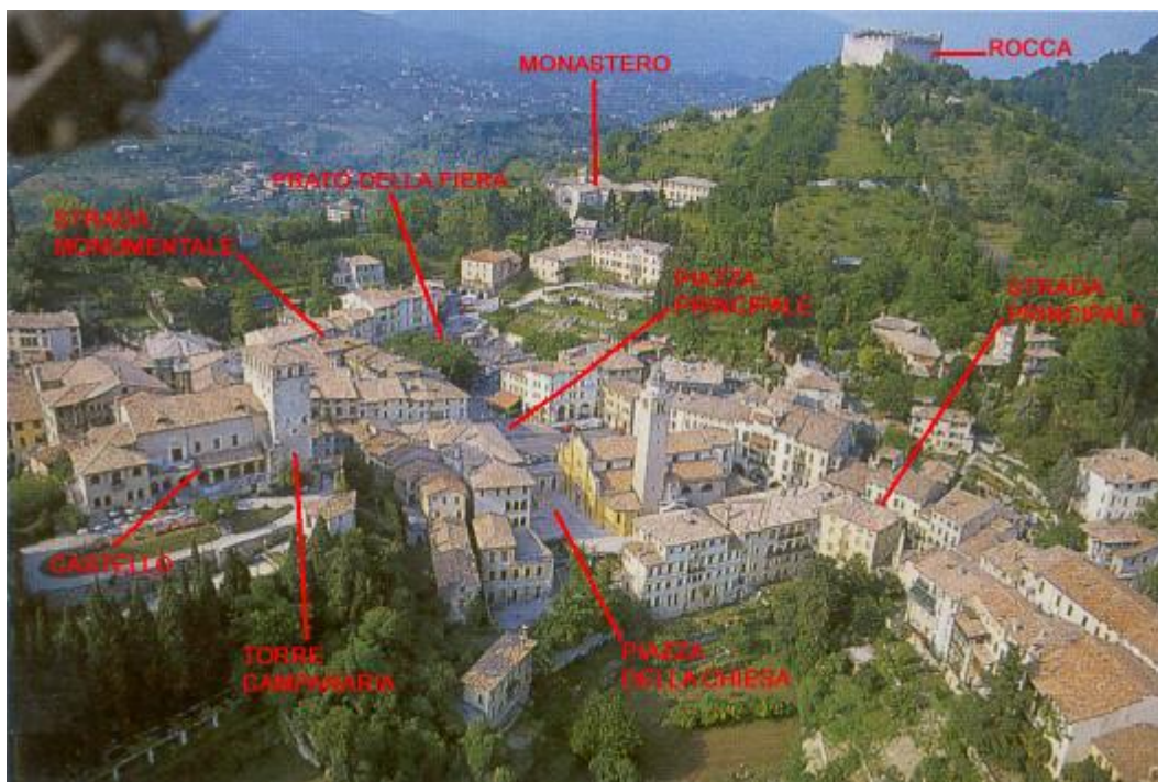
Vista aerea tematizzata

Ma, come sempre succede, sarà di fatto impossibile ritematizzare l'intera città, sicché la piazza principale resterà per tutti quella più antica, la loggia resterà il simbolo della comunità cittadina – anche se ora ospita il Museo Civico - e un nuovo teatro, della medesima tempra di quello nel castello, verrà realizzato in memoria della settecentesca Accademia dei Rinnovati.