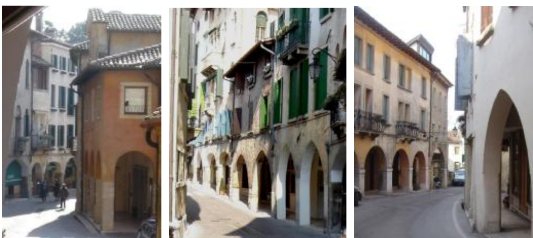
La caratteristiche medievali della strada principale

Se qualche primo palazzo rinascimentale è stato costruito proprio sulla strada principale – accanto alla prima porta, per farlo inquadrare dalla strada che conduce, dopo la piazzetta dell’antica posta e oggi piazza Marconi, a una successiva porta – la strada monumentale del Cinquecento prenderà l’avvio dalla parte opposta della piazza principale, seguendone un primo embrione lungo il tracciato viario che raggiungeva più a valle la seconda porta della città e già in parte edificato