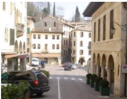
Il palazzo municipale – a destra - sulla via Cornaro e sullo sfondo la piazza principale con l’origine della strada principale