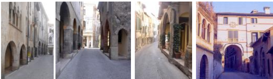
I portici nel primo tratto della strada monumentale e l'antica porta