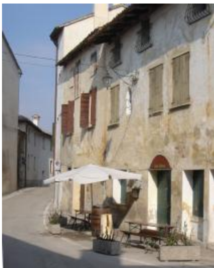
L'antico crocicchio con la sua osteria

La sequenza prosegue con palazzi sempre più ricchi, con giardini accurati, con la lontana e perentoria villa Contarini sul colle, con la curiosa conclusione della “casa longobarda”, superbamente decorata dallo scultore della regina, quasi anticipando la casa che Pompeo Leoni, lo scultore di Carlo V, costruirà per sé a Milano con l'imponente presenza di quattro cariatidi maschili, gli Omenoni.