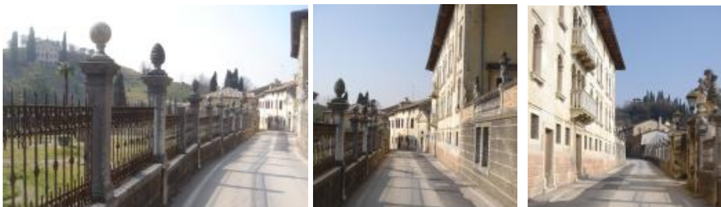
La sequenza della strada monumentale con il “crescendo” fino alla villa Contarini sulla collina, e uno sguardo all'indietro

La sequenza prosegue con palazzi sempre più ricchi, con giardini accurati, con la lontana e perentoria villa Contarini sul colle, con la curiosa conclusione della “casa longobarda”, superbamente decorata dallo scultore della regina, quasi anticipando la casa che Pompeo Leoni, lo scultore di Carlo V, costruirà per sé a Milano con l'imponente presenza di quattro cariatidi maschili, gli Omenoni.