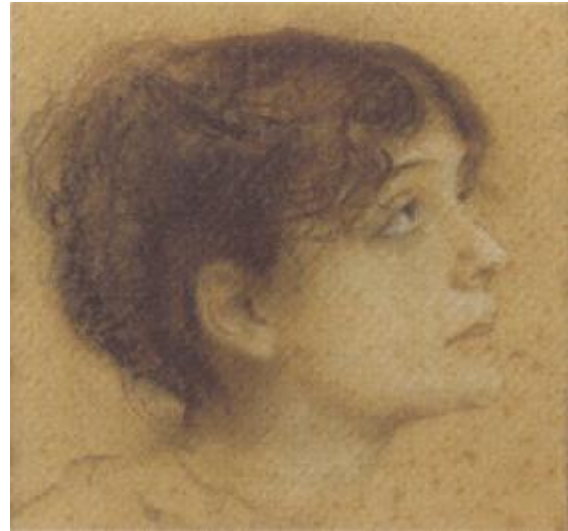
Caterina Corsaro ed Eleonora Duse, le due donne di Asole

Conventi francescani erano infatti qui comparsi soltanto nel Cinquecento, il primo proprio sotto alla rocca – ma di questo nulla rimane – dove un secolo dopo verrà costruito per le monache benedettine il monastero di San Pietro: ma sia il loro ritardo sia l'essere disposti fuori dalla città sembrano suggerire un'area della cristianità sostanzialmente estranea ai movimenti ereticali, seppure percorsa dopo la riforma dalle inquietudini ricostruite da Carlo Ginzburg ne Il formaggio e i vermi .