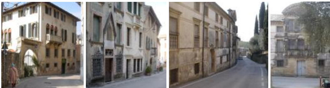
I palazzi del Rinascimento e dell'Ottocento lungo la via Canova

Davanti all'antica chiesa di santa Caterina e all'annesso Ospedale – oggi caserma dei Carabinieri - la sequenza rinascimentale ha una pausa in una preesistente piazzetta, forse un tempo con la medesima osteria di oggi.