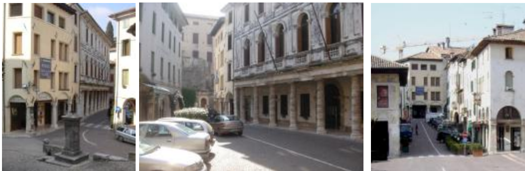
La piazza monumentale vista ai piedi del castello e dalla strada monumentale A sinistra la larga e diritta via Cornaro dalla piazza principale al castello

talvolta le vie medievali delle città venete (come Padova) anche quando non vi siano botteghe, mentre quelli rinascimentali saranno poi privi di portici.