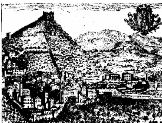
L'interpretazione di una stampa antica

Sicché Asolo resta dopotutto un antico borgo medievale, allineato lungo una strada principale porticata disposta tra la piazza principale e una delle porte, protetto come molti altri da un castello e sorvegliato da una rocca, dove tanto più singolare risalta la sequenza della lunga strada monumentale del Rinascimento che la rende una città di una bellezza singolare e che un'antica stampa sembra sintetizzare.