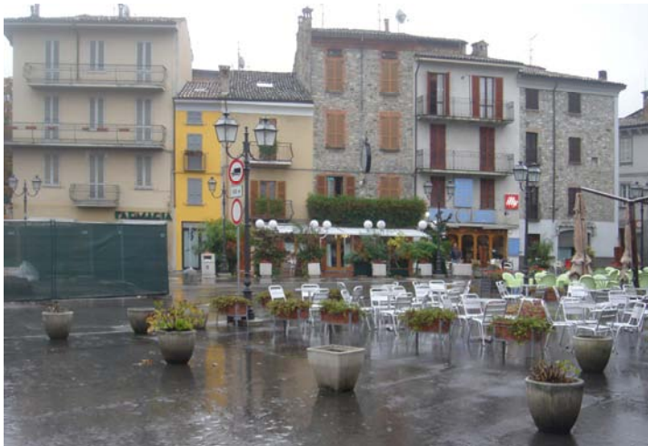
Il prato della fiera

Il borgo cresce del tutto autonomo ai piedi dell'abbazia - del resto ormai di declinante fortuna - con una forma analoga alle altre città contemporanee, una lunga strada principale che inizia dalla porta, demolita con le mura a fine Ottocento, aperta sul prato della fiera, dove vengono costruiti il convento e la chiesa di San Francesco, dunque anche piazza conventuale e oggi tematizzato come piazza nazionale da un monumento ai partigiani caduti e dalle sedi delle banche e delle poste.