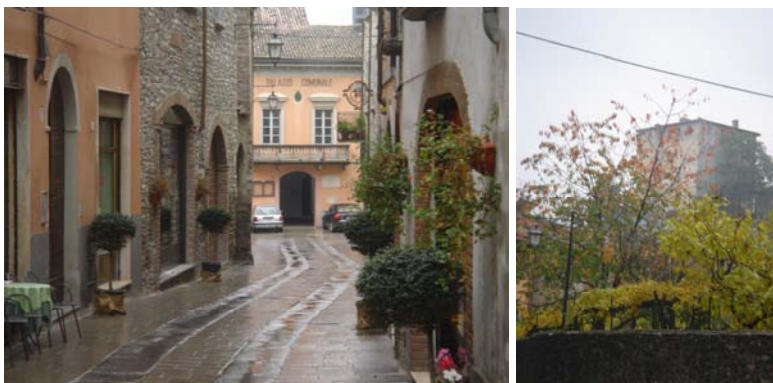
La veduta trionfale del municipio e il castello dal parco

La strada monumentale, diradati pian piano i palazzi, sale su su fino al castello - oggi circondato da un parco – connotando così il suo legame simbolico con l'accesso privilegiato dalla piazza principale della città, mentre dall'altro lato, scendendo a fianco del parco con una breve e pittoresca strada porticata, la contrada del Castellaro sarà un piccolo borgo quasi a servizio del castello, secondo un genere che vediamo anche altrove, dal quale chi la segua scenderà infine al prato della fiera con la chiesa di san Francesco, quasi il suo ingresso di servizio.