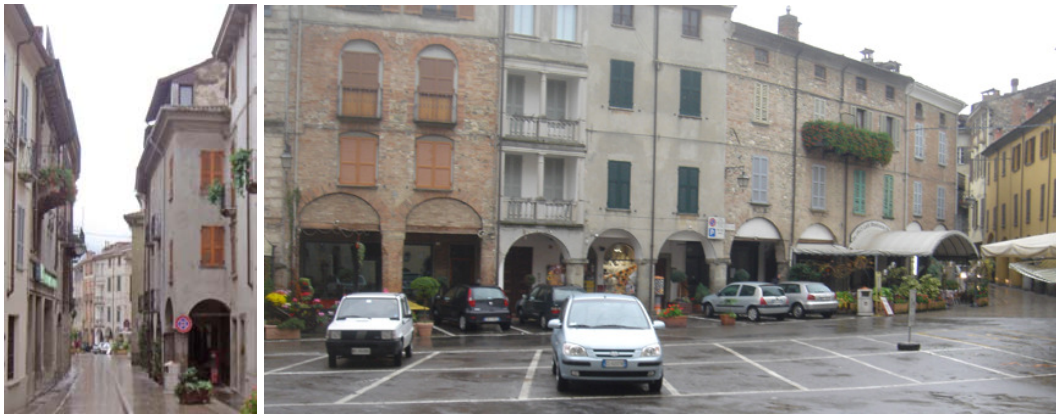
La strada principale e la piazza principale con il suo celebre caffè

La piazza principale non è proprio al centro dell'abitato – perché come a Pienza la campagna comincia inaspettata subito dietro l'abside della chiesa – ma è al centro della strada maestra, in sequenza con la strada monumentale sorta, come accade sovente quando una strada maestra attraversa la città, nel suo secondo tratto, con il trecentesco palazzo “della regina Teodolinda”, con altri palazzi gotici e – a mostrare il persistere nrel tempo del suo significato - con il settecentesco palazzo Olmi.