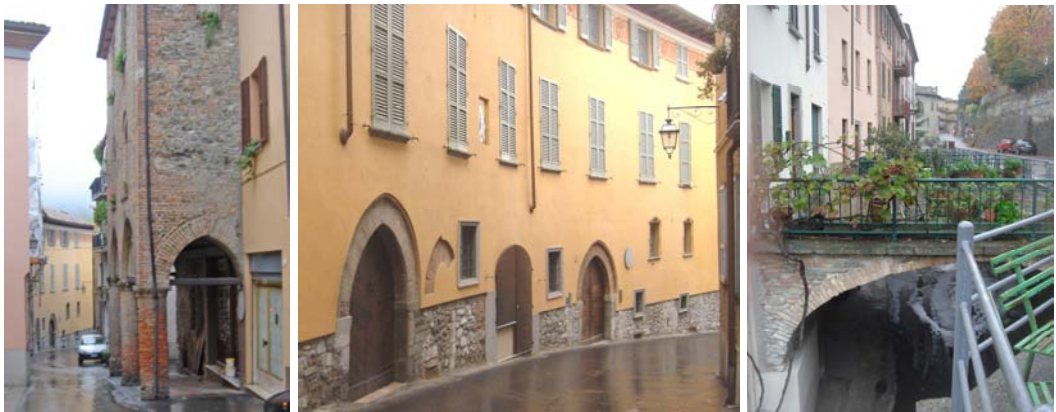
Il breve tratto di strada monumentale e il singolare boulevard

La strada maggiore è conclusa dalla porta Alcerina, oltre la quale una evidente volontà di adottare le sequenze emerse nelle città più grandi indurrà a tracciare un modesto boulevard sul sedime delle mura antiche a partire da piazza San Francesco, anche se qui le sue case, gli alti condomini della modernità, dovranno venire audacemente costruiti in falso, connessi con un curioso sovrappasso.