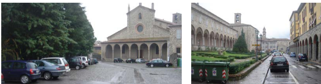
Piazza San Colombano e la retrostante piazza Santa Fera

La chiesa e l'abbazia di San Colombano restano ora al centro di queste sequenze disposte a triangolo – le due connesse con il castello e la strada principale – e costituiscono il cuore di un'altra sequenza, una sequenza cospicua ma nella quale ogni cosa è intrisa di una ambiguità che le rende vagamente malinconiche. L'edificio in sé è modesto (ché quando arriveranno i costruttori romani ha già perso la sua rilevanza, e dopo la confisca repubblicana nel 1801 verrà utilizzato come scuola); sulla piazza davanti alla facciata, pur tematizzata, prospettano indifferenti case borghesi del primo Novecento mentre a ridosso delle sue absidi è stata realizzata la passeggiata della città che – con un porticato in stile quattrocentesco e, di fronte, uno in stile moderno – pretende un ruolo monumentale vagamente incongruo, così inusuale da venire interpretata anche come un giardino pubblico e in parte, ai piedi della chiesa che vediamo sullo sfondo, come mercato: forse semplice segno dell'imbarazzo della cittadinanza contemporanea per questo ingombrante relitto di una vicenda morta da dieci secoli.