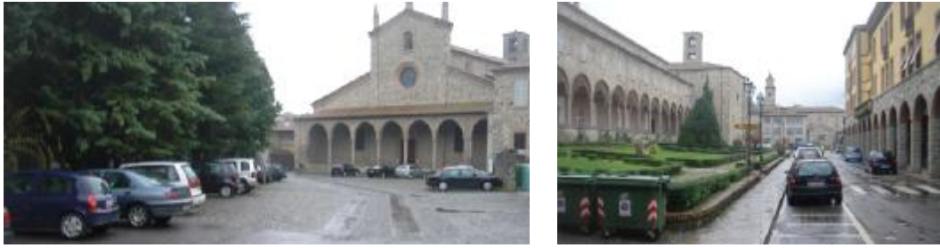
Piazza San Colombano e la retrostante piazza Santa Fera