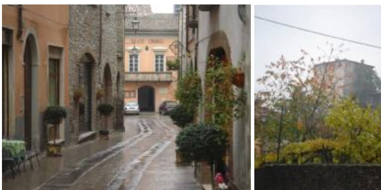
La veduta trionfale del municipio e il castello dal parco

Da un lato con una strada monumentale, che sale tortuosa dalla piazza principale, contrassegnata da qualche ultimo portico e con a sinistra la veduta trionfale del nuovo municipio - un tempo convento di Santa Chiara e oggi biblioteca e auditorium. Qui gli stretti lotti gotici che ci avevano accompagnato fin dalla piazza San Francesco hanno dato luogo a lotti più ampi per i nuovi palazzi aristocratici, il palazzo Tamburelli e quello imponente dove risiedevano i Malaspina – se il castello era il simbolo del lignaggio aristocratico il palazzo, simile a quelli dei maggiorenti nelle strade stesse della città, era il simbolo della loro appartenenza alla sfera della civitas accanto ai cittadini - su su fino al castello oggi circondato da un parco.