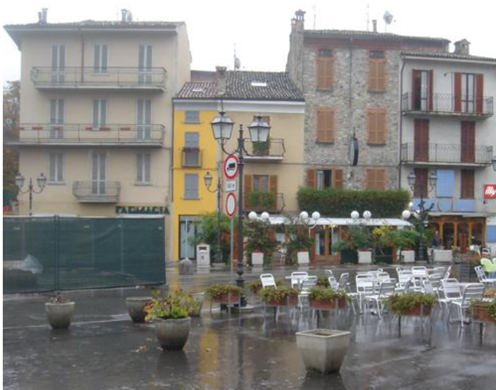
Il prato della fiera

Il borgo cresce del tutto autonomo ai piedi dell'abbazia - del resto declinante - con una forma analoga alle altre città contemporanee, una lunga strada principale che inizia dalla porta, demolita con le mura a fine Ottocento, sul prato della fiera, dove vengono costruiti il convento e la chiesa di San Francesco, oggi tematizzato come piazza nazionale da un monumento ai partigiani caduti e dalle sedi delle banche e delle poste.