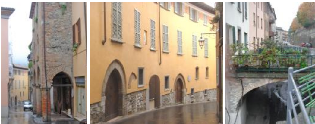
Il breve tratto di strada monumentale e il singolare boulevard

La piazza principale non è al centro dell'abitato – perché come a Pienza la campagna comincia inaspettata subito dietro l'abside della chiesa – e neppure al centro della strada maestra: il suo secondo tratto è una prima breve strada monumentale (con il trecentesco palazzo “della regina Teodolinda” e altri palazzi gotici, e il settecentesco palazzo Olmi) in sequenza alla porta Alcerina con un modesto boulevard sul quale prospetta qualche condominio connesso con un curioso sovrappasso, oltre il quale la via Francigena scendeva fino al ponte Gobbo, undici arcate per attraversare il Trebbia, oggi sottratto al traffico e promosso a simbolo della città.