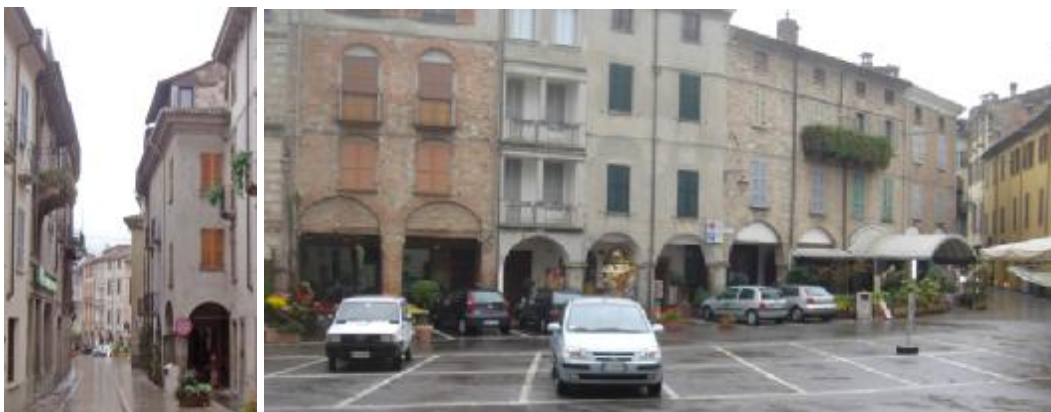
La strada principale e la piazza principale con il suo celebre caffè

La piazza principale non è al centro dell'abitato – perché come a Pienza la campagna comincia inaspettata subito dietro l'abside della chiesa – e neppure al centro della strada maestra: il suo secondo tratto è una prima breve strada monumentale (con il trecentesco palazzo “della regina Teodolinda” e altri palazzi gotici, e il settecentesco palazzo Olmi) in sequenza alla porta Alcerina con un modesto boulevard sul quale prospetta qualche condominio connesso con un curioso sovrappasso, oltre il quale la via Francigena scendeva fino al ponte Gobbo, undici arcate per attraversare il Trebbia, oggi sottratto al traffico e promosso a simbolo della città.