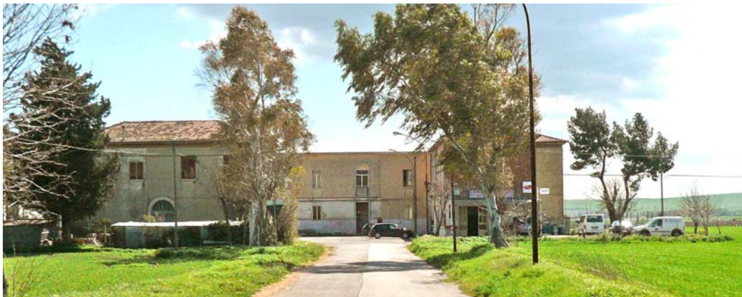
La breve strada trionfale davanti alla casa del fascio