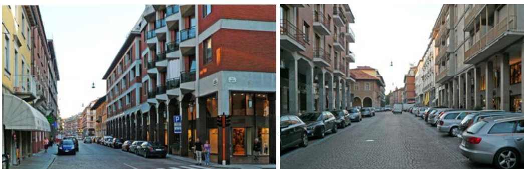
La strada principale moderna

Chi entri oggi a Bra, risalendo dalla valle del Tanaro, riconosce subito una strada principale che la attraversa da est a ovest, una strada principale – porticata, secondo una consuetudine molto diffusa dal Trecento ma rara in questa parte del Piemonte - con molti negozi e con un aspetto clamorosamente moderno, di tale vigore architettonico da farla ritenere anche intrisa di una volontà monumentale: e questa modernità manifesta a prima vista una vera e propria trasgressione, ché in una città modesta come Bra la strada principale ha di solito la tendenza a rimanere la medesima nel corso dei secoli, e dunque ci aspetteremmo un aspetto più antico.