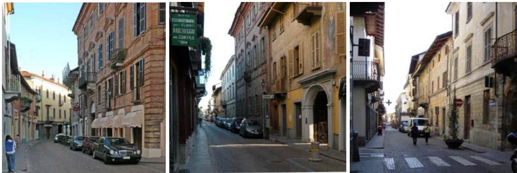
La strada monumentale

A partire da questa croce la strada principale più antica continua diventando una strada monumentale – dove sono schierati i palazzi dei maggiori – secondo del resto una sequenza ricorrente in molte città, dove strada principale e strada monumentale sono spesso una di seguito all'altra, fino a una piazza recente tematizzata da una chiesa, dove termina anche la strada principale moderna, che dopo la croce con via Cavour ha tuttavia perso i suoi portici e i suoi negozi.