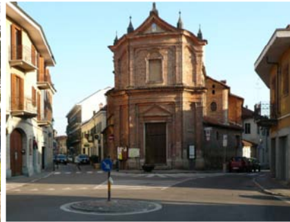
La chiesetta barocca e la Y

Così questa sembra una città doppia, non con la perentorietà di Nancy o di Ragusa Ibla, ma comunque con due sequenze ben riconoscibili, entrambe con la loro strada principale e con la loro strada monumentale, l'una poi con la piazza tematizzata dal palazzo municipale e dalla chiesa principale e contrappuntata dal prato della fiera e da un giardino pubblico, l'altra con la piazza tematizzata dal teatro e dal contrappunto con lo square della stazione con un altro giardino pubblico: ma, ecco, se le due sequenze sembrano specchiarsi in un contrappunto puntuale, le due anime della città restano, a ben vedere, clamorosamente distinte, la sfolgorante sequenza di chiese della città religiosa – progettate persino dal Bernini e dal Vittone - non deborda nella città laica, dominata dalla stazione ferroviaria, dove passa quel treno e quella civiltà nuova che Carducci allora contrapponeva proprio alla divinità antica.