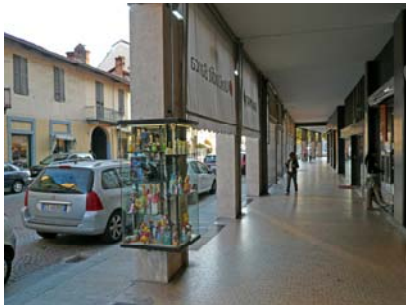
La strada verso la piazza moderna

Perché questa larga piazza moderna contrappunta clamorosamente la piazza antica, e se il palazzo municipale resterà là sopra quella moderna sarà tematizzata dal teatro, e se quella antica è poi di fatto il contrappunto di tre piazze che vanno allargandosi verso la vista delle Langhe, quella moderna - anch'essa piazza del mercato - verrà contrappuntata da uno square alberato, un altro giardino pubblico, davanti alla stazione dove corre il boulevard che racchiude la sequenza della città laica. Ma la radice di questo boulevard è poi in una Y davanti a una chiesetta barocca, all'arrivo della via di Torino, il cui ramo sinistro ci riconduce alla città antica: quasi a sottolineare che questo contrappunto di temi e di sequenze e questo contrapporsi di significati stanno pur sempre all'interno di una medesima città