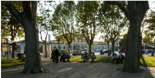
Il giardino pubblico e la stazione