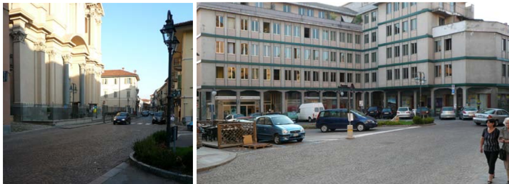
La piazza moderna

La cosa singolare è che le due strade principali, legate dalla breve via Cavour, non soltanto costituiscono un inedito contrappunto, ma sono l'anima rispettivamente di una città vecchia e di una città nuova, a loro volta costituite da temi collettivi