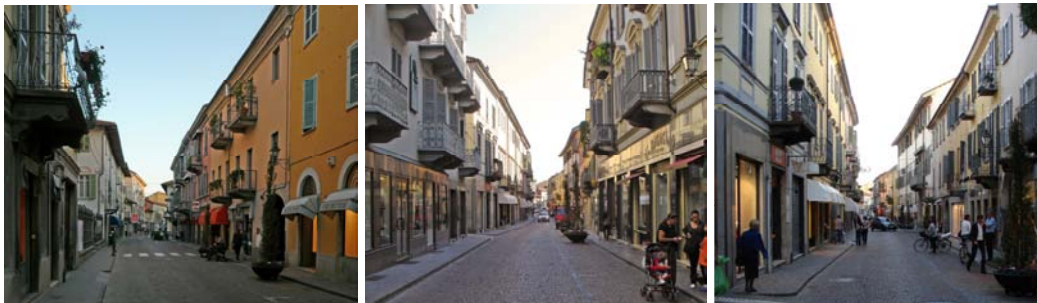
La strada principale antica

La sequenza canonica con la piazza principale resta tuttavia appena avvertita non soltanto a causa del diaframma costituito da questo isolato, ma piuttosto perché in realtà la strada principale, con i suoi negozi, termina praticamente di fronte a una breve strada trionfale tematizzata da due chiese – oggi la via più chic con i caffè più eleganti – sorprendentemente a legare la strada principale moderna, che costituisce così il contrappunto di quella antica, dando luogo una forma che grossolanamente richiama una H e che costituisce una autentica rarità, la cauta manifestazione di una deliberata volontà stilistica.