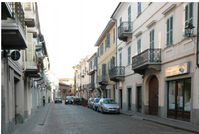
Il primo tratto della strada principale