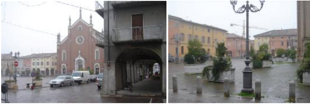
Piazza principale e piazza di mercato

Lo schema simmetrico delle città fondate dalla scuola toscana viene dunque riproposto come un semplice tracciato regolatore dove disporre le strade e le piazze tematizzate con la loro dimensione e con le loro sequenze appropriate, e sul quale innestare la quadratura delle strade di lottizzazione, larghe 7 metri - in un solo isolato di 4 metri -, una larghezza a quei tempi molto ampia che consentiva il passaggio di quattro carri per volta e permetteva poi di guardare con agio le facciate delle case.