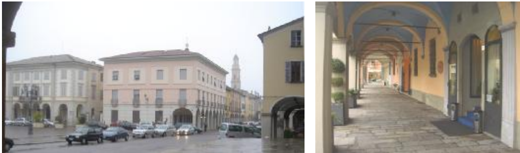
Il portico mancante sulla piazza accanto al municipio e il portico sul lato ovest

sulla piazza principale l'edificio sull'angolo con la strada principale (un tempo, quando la piazza era diventata giardino pubblico, albergo) ne resterà privo - e beninteso anche nel colore molto vario delle facciate.