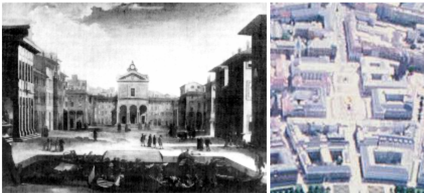
La doppia piazza di Livorno e di Karlsruhe

A Cortemaggiore la piazza al centro della città è piazza del mercato, circondata da portici, con la chiesa in posizione dominante e il palazzo municipale in una posizione subordinata, schema che verrà ripreso a Livorno settant'anni dopo ma con una differenza sostanziale: la piazza centrale è, davanti alla chiesa, anche piazza del mercato – quindi porticata - e si allarga in una seconda sezione più ampia dove è affacciato il palazzo municipale. E' l'idea di una piazza complessivamente unitaria divisa in due sezioni di grandezza diversa e rispettivamente tematizzate dalla chiesa e dal palazzo municipale, idea ripresa più tardi a Karlsruhe.