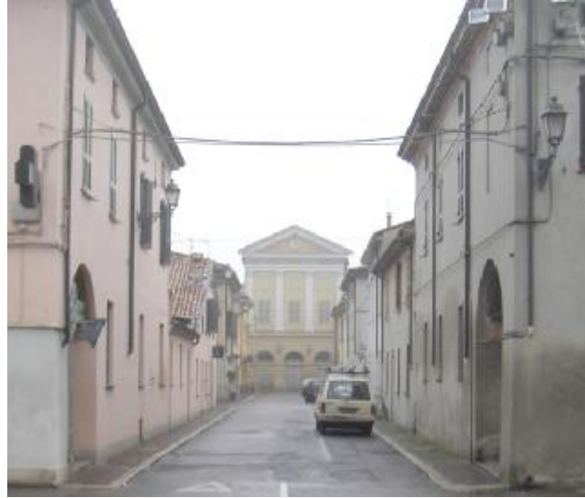
Le strade trionfali