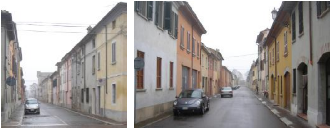
Le strade secondarie

Lo schema simmetrico delle città fondate dalla scuola toscana viene dunque riproposto come un semplice tracciato regolatore dove disporre le strade e le piazze tematizzate con la loro dimensione e con le loro sequenze appropriate, e sul quale innestare la quadratura delle strade di lottizzazione, larghe 7 metri - in un solo isolato di 4 metri -, una larghezza a quei tempi molto ampia che consentiva il passaggio di quattro carri per volta e permetteva poi di guardare con agio le facciate delle case.