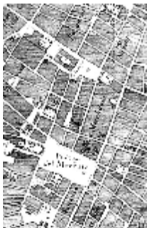
La piazza del mercato e la piazza principale all'Aquila

anche la piazza della chiesa, che quindi come all'Aquila o a Venezia è legittimo la domini.