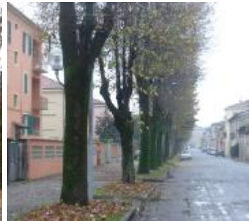
Il boulevard e la passeggiata