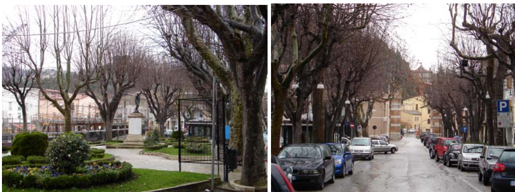
Il giardino pubblico e il viale alberato con l'arco trionfale

In secondo luogo, annunciata quasi lungo il Borgo dalla chiesa di Santa Chiara, davanti al palazzo municipale sulla piazza principale al centro della città non vediamo la Cattedrale – come potremmo aspettarci – ma la chiesa di San