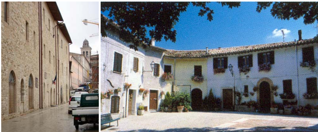
La sequenza verso la Cattedrale e la piazza del mercato

La piazza principale è a sua volta il cuore di un'altra sequenza. Che ha verso monte, annunciata sulla piazza dalla chiesa della Madonnina – cuore del fitto contrappunto di tre chiese una di seguito all'altra – una sorta di cittadella religiosa con la cattedrale, il palazzo vescovile e il seminario, evidente traccia di un secolare dominio pontificio che a partire dal Quattrocento ha dato alla città la sua pace: un dominio poi sottolineato simbolicamente dalla torre sulla vetta del colle, resto di una rocca che sembra evocare una signoria feudale mai di fatto esistita, nel comune di Nocera, semmai affiliato a quello di Perugia. Sequenza che verso valle inanella poi la piazza del mercato, con la traccia nel pavimento della vecchia torre di San Giovanni – che le dà il nome – chiesa del vicino monastero delle Clarisse per richiudersi in basso sulla porta medievale.