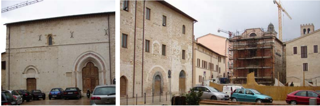
San Francesco e la piazza principale con il palazzo municipale e la chiesa della Madonnina

Francesco, a rammentarci che a Nocera la devozione francescana ha radici saldissime: perché proprio qui, nel 1226, il Santo principiò a morire e venne trasportato subito ad Assisi per rendere l'anima a Dio tra i suoi confratelli, nella Porziuncola.