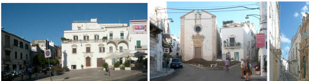
I palazzi settecenteschi sullo sfondo di piazza Sant'Oronzo e la chiesa dello Spirito Santo; sulla destra via Imbriani con uno dei suoi palazzi