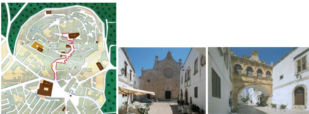
Piazza del duomo con il rosone e l’arco che la chiude

A ridare un senso alla “terra” sarà, qualche decina di anni fa, la rivalutazione europea dei centri storici: soltanto che a Ostuni l’incertezza sullo status dei portali nella cultura architettonica consolidata convincerà quasi a trascurarli, ricoprendo tutta la città di calce proprio come fanno i paesi delle isole greche, che lo sflogorio di una tradizione scultorea radicata nel rosone della cattedrale e via via intrecciata nelle strade non se la sognano nemmeno: la città ora è bianca, ma è il bianco del sudario.