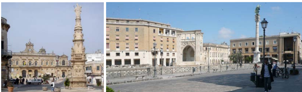
La piazza di Ostuni e la piazza sant'Oronzo a Lecce

E questo contrappunto ha subito un senso. Sant'Oronzo è anche il protettore di Lecce – che ha a sua volta nella piazza principale una colonna con il medesimo Santo – e la guglia di Ostuni, così ricca e ridondante, vuole sottolineare nel confronto la crescente prosperità della città, dovuta soprattutto alle masserie, e la consapevolezza di sé di un ceto proprietario che intende esaltarla in una nuova piazza aperta appena fuori porta, quella porta della quale restano oggi solo le fondazioni, con i suoi nuovi palazzi davanti alla chiesa dello Spirito Santo e su lungo la strada adiacente, via Imbriani, fino all'antica chiesa dell'Annunziata.