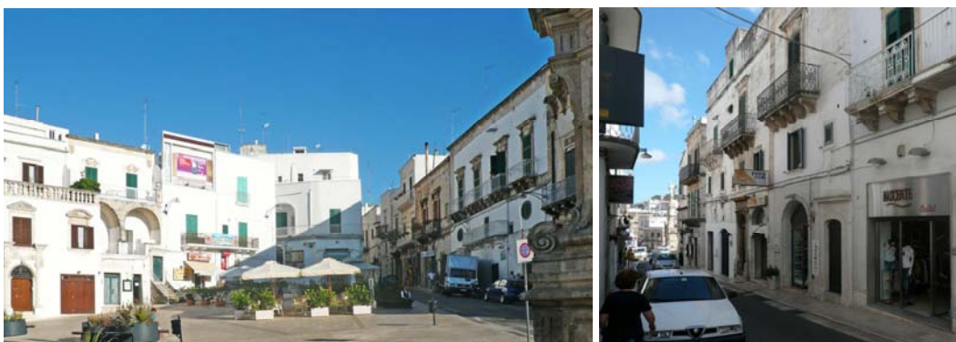
Corso Cavour risale da piazza sant’Oronzo

Dalla parte opposta, da piazza sant’Oronzo, spicca più stretta la nuova strada principale, con tutti i negozi all’altezza dei tempi, anima della sequenza con la piazza nazionale – piazza Matteotti con il monumento ai caduti – e subito di seguito con il giardino pubblico: una sequenza, quella della strada monumentale, della piazza principale e della strada principale comune del resto a molte città europee, quelle con le quali ora Ostuni vuole confrontarsi.