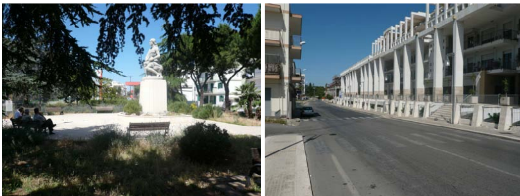
La statua di Cristo Re e il nuovo complesso contemporaneo

Solo che l'ingresso ottocentesco nella modernità ha avuto a Ostuni un curioso e imprevisto risvolto: il declino della sfera simbolica della città antica.