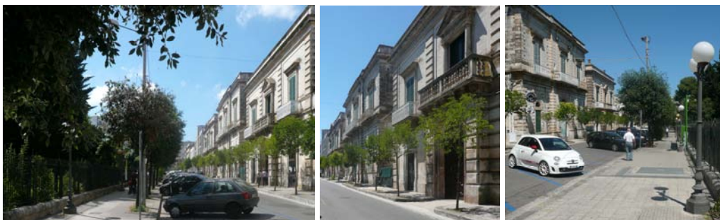
Il fronte monumentale del giardino pubblico è ora la via Martiri di Kindu

Ma nella seconda metà del XIX secolo irrompe un nuovo stile di vita e matura una nuova e moderna – anche nella sua veste architettonica – strada principale, viale Pola, con tutti i negozi più alla moda, una strada nuova coerentemente connessa alle sequenze preesistenti e a sua volta anima di una sequenza radicata nel sinuoso tracciato di una strada antica – corso Garibaldi, il seguito di via Cavour, dove sono sopravvissute le modeste case di un tempo, forse costruite prima ancora del Novecento – e che tocca per prima la piazza del convento dei Cappuccini con la statua di padre Pio, poi piazza Italia con la facciata a colonne di una grande scuola, per terminare con la statua di Cristo Re e soprattutto con un enorme fabbricato che sembra voler consolidare l'ambizione di Ostuni, entrata trionfalmente nel Novecento, di voler entrare altrettanto trionfalmente nel XXI secolo.