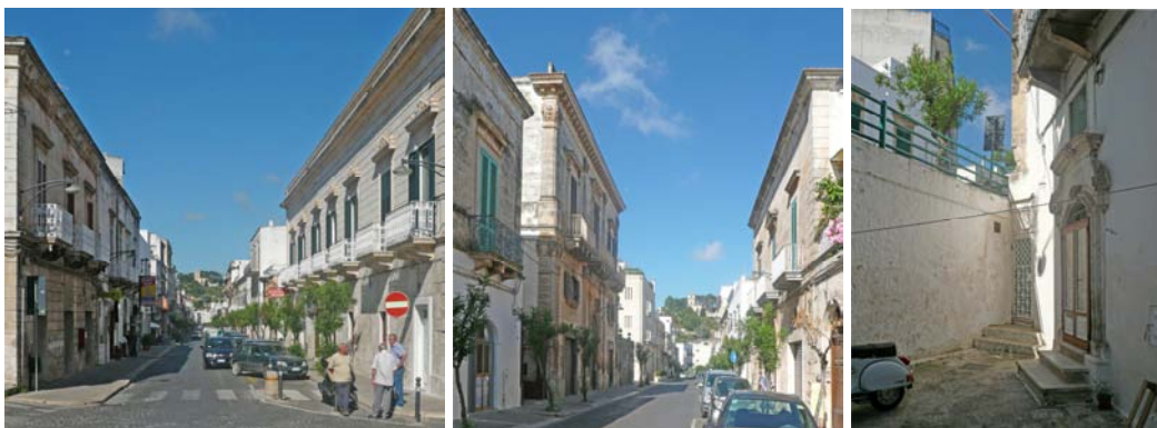
Corso Mazzini e, a destra, una delle vie a valle tagliate dal suo rilevato – come in largo Lanza - con un portale del 1784

Dalla parte opposta, da piazza sant’Oronzo, spicca più stretta la nuova strada principale, con tutti i negozi all’altezza dei tempi, anima della sequenza con la piazza nazionale – piazza Matteotti con il monumento ai caduti – e subito di seguito con il giardino pubblico: una sequenza, quella della strada monumentale, della piazza principale e della strada principale comune del resto a molte città europee, quelle con le quali ora Ostuni vuole confrontarsi.