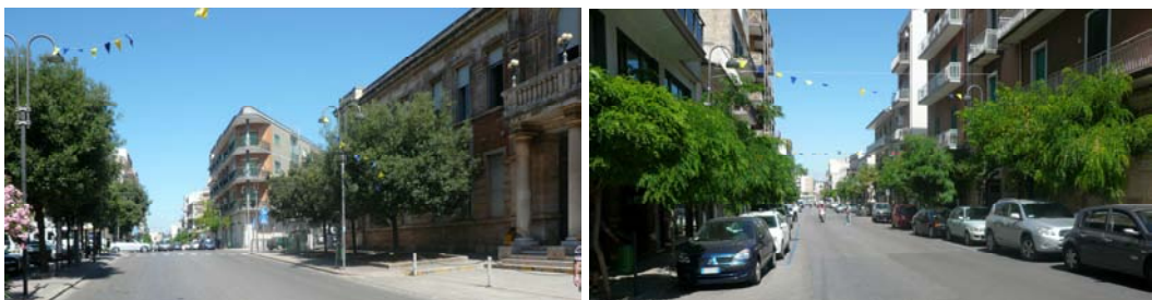
Viale Pola da piazza Italia