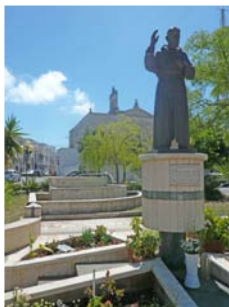
Padre Pio e la chiesa dei Cappuccini