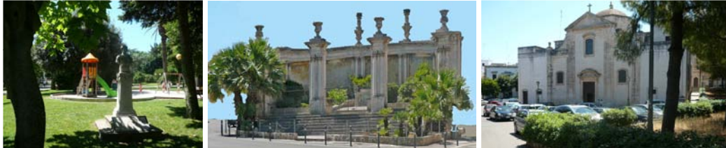
Il giardino pubblico e l'edera che lo chiude davanti alla chiesa della Madonna delle Grazie

E qui, nei primi decenni del Novecento, la nuova borghesia di Ostuni mostra davvero il meglio della propria consapevolezza di sé schierando lungo il giardino pubblico – che viene concluso con un'edera - le sue nuove dignitosissime case che non sembra abbiano da invidiare a quelle contemporanee in altre città d'Italia.