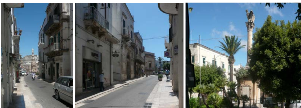
Corso Cavour da piazza Sant’Oronzo verso piazza Matteotti, con la colonna del suo monumento ai Caduti