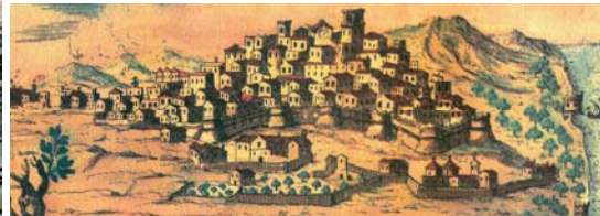
L'attuale largo Lanza e la vista di Ostuni nel catalogo del Pacichelli (1703)

Le due piazze saranno tuttavia anche il cuore di un rinnovamento più vasto e complesso che vuole voltare le spalle alla città vecchia, quella chiusa nelle mura tardo quattrocentesche erette per difendersi dalle scorrerie dei turchi – un contesto vissuto ormai come arcaico e quasi rurale - costruendo la sequenza di nuove strade tematizzate tracciate sul modello di una città europea moderna.