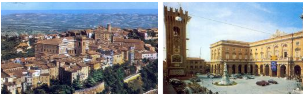
La piazza principale, la torre e il palazzo municipale

una strada principale vera e propria e in una strada monumentale: l'antica contrapposta identità dei quartieri, il loro confronto sul terreno, si scioglie ora in una strategia estetica che coinvolge la città tutta intera.