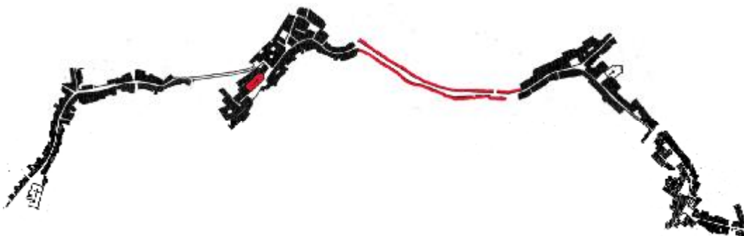
Castelnuovo, Monte Volpino, la strada maestra, Monte Muzio e Monte Morello

E' a questo modello di strada-piazza che viene fatto ricorso a Recanati per dare un tema simbolico unitario alla città intera, strada-piazza che diventa così il tema cittadino di maggior rilievo - dove i benedettini costruiranno subito, nel 1192, una loro grande abbazia, contrappunto di quella antica di Castelnuovo, fondata dai monaci di Fonte Avellana - e terreno di un confronto tra i tre preesistenti castelli.