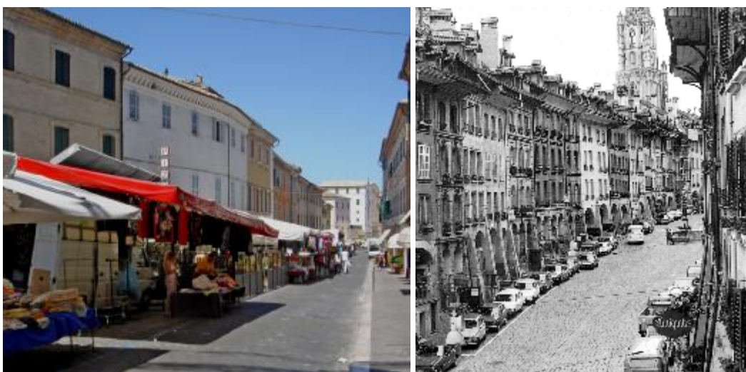
La strada-piazza di Recanati e quella di Berna

Da un lato, promossa San Flaviano a cattedrale, gli abitanti di Monte Volpino vorranno un'altra chiesa tutta per loro, Sant'Angelo, edificata nei primi decenni del Duecento quasi alla metà della strada maestra - più o meno all'altezza dell'ingresso attuale della piazza principale - e pretenderanno che da allora in poi negli Statuti comunali l'intero quartiere assuma la nuova denominazione di rione appunto di Sant'Angelo, anche se la chiesa diventerà effettivamente parrocchia soltanto nel 1517 e per l'occasione ricostruita ab imis .