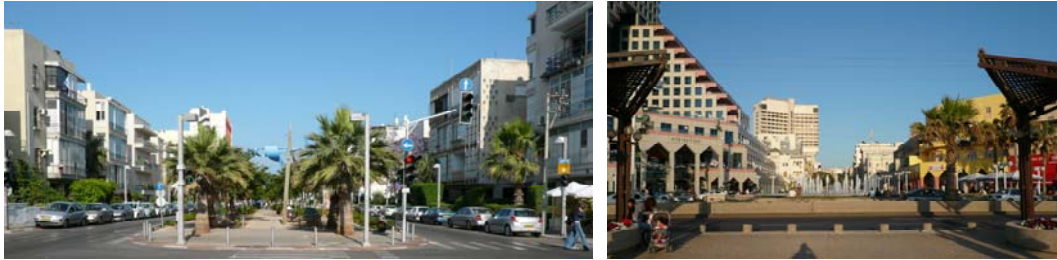
La passeggiata di Geddes e la passeggiata moderna che la contrappunta a sud

La concezione di Geddes ha poi un riscontro clamoroso nell'architettura. Da un lato nel corso degli anni Trenta molte famiglie ebraiche sono prudentemente emigrate dalla Germania e hanno costruito a Tel Aviv le proprie nuove case proprio in quel medesimo stile Bauhaus - condannato dai nazisti e dunque di per sé bandiera di una colta resistenza - con quelle asimmetrie coltivate da Gropius, soprattutto nel boulevard Rotschild, che resta uno dei musei architettonici all'aperto più singolari del mondo. Dall'altro lato l'eredità della cultura progressista europea ha suggerito fin dagli anni Trenta di privilegiare case a soli quattro piani, diventate l'impronta caratteristica del centro cittadino che ha assunto un aspetto déco forse comparabile soltanto a quello della Miami di allora.