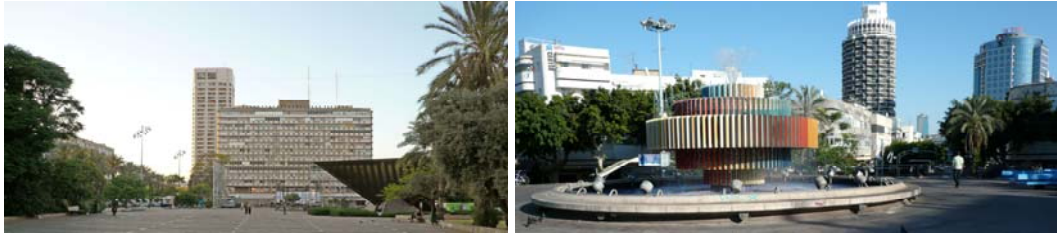
La piazza nazionale e la piazza monumentale nelle versione contemporanea