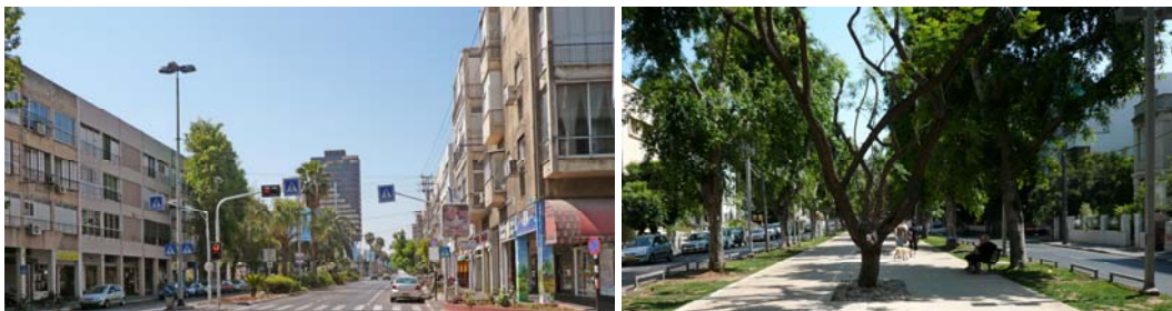
La strada principale e il boulevard Rotschild

Dopo ottantacinque anni le intenzioni estetiche di Geddes sono ancora evidenti, strade e boulevard le rispecchiano puntualmente.