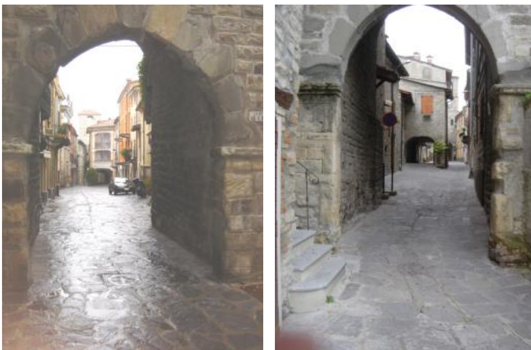
La piazza vista da porta Soprana e da porta Sottana

Scendendo dalla piazza principale il cuore dell'insediamento originario è la pittoresca strada/piazza chiusa alle estremità da due porte turrite, a destra la porta Sottana o torre Mangini, e a sinistra la porta Soprana o torre dell'orologio, dove venivano chieste le gabelle ai viaggiatori e ai mercanti: in origine dunque piazza di mercato ha poi acquisito il carattere di una strada monumentale quando vi sono stati costruite insieme, nel 1636 la prima e nel 1646, le chiese gemelle dei Rossi e dei Bianchi, e vi è stato riattato palazzo Mangini, creando un doppio contrappunto (le due torri con le due porte e le due chiese, le une di fronte alle altre) un piccolo gioiello espressivo forse unico che tuttavia i nuovi interventi edilizi stanno snaturando.