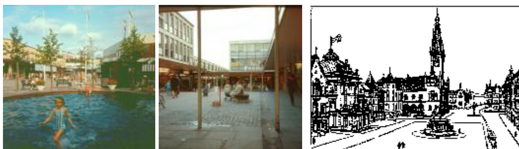
I centri di Farsta a Stoccolma, di Stevenage in Inghilterra e un disegno di Henrici per Monaco di Baviera

A un nuovo centro possono venir date forme moderne (come ancora negli anni Cinquanta del Novecento nelle new towns inglesi o nei quartieri nuovi di Stoccolma) oppure può venire disegnato in forme che suggeriscano trattarsi di un insediamento vecchio di mille anni come aveva immaginato Henrici per Monaco di Baviera.