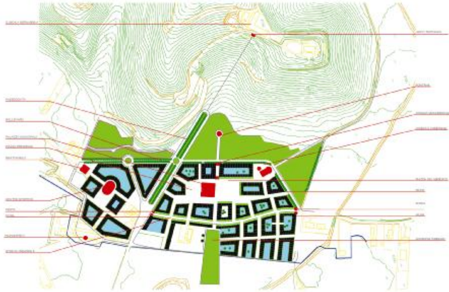
progetto per Borgo Ceretto