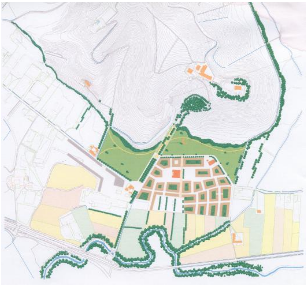
suggerimento per il parco di Andreas Kipar