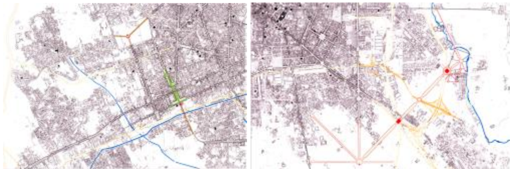
Le zone sud ovest e sud est