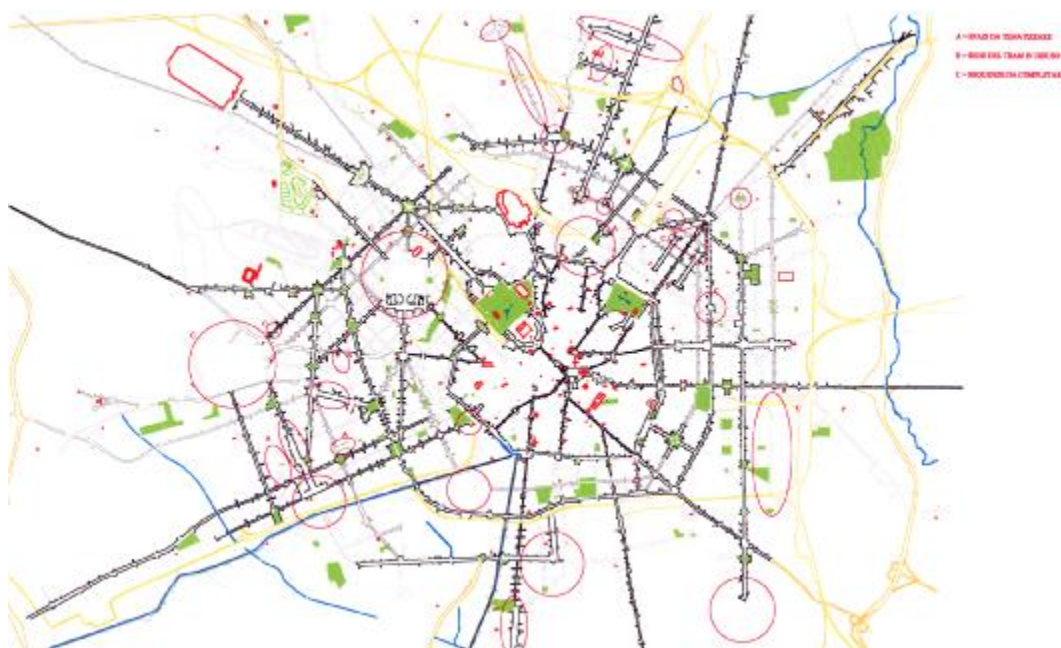
Gli ambiti critici della città

Questo lavoro – insieme alla survey eseguita per il progetto delle otto porte per Milano – ci ha suggerito di mettere in evidenza gli altri siti che in città sembrano a prima vista bisognosi di un intervento di ridisegno urbanistico, un suggerimento che abbiamo messo a punto di nostra iniziativa e che vorremmo potesse contribuire, insieme al progetto di ponte Lambro, a rendere più puntuali e mirati i programmi dell'amministrazione cittadina.